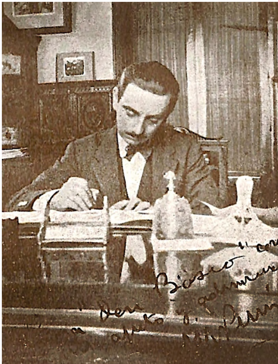
Fotografía de José María Pemán, dedicada a la revista Don Bosco en España , enero de 1929.