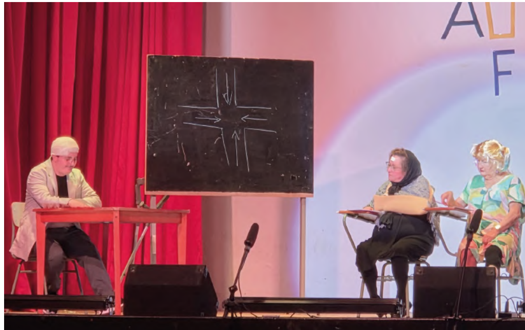
Actuación del Grupo de teatro...

Como es ya tradición, la Asociación de Antiguos Alumnos de Cádiz celebró durante el mes de enero su certamen de música y teatro, enmarcado en los actos conmemorativos de la festividad de Don Bosco. Una propuesta cultural abierta no solo a los asociados, sino también a toda la Familia Salesiana y a la Comunidad Educativa, que volvió a poner en valor el arte como espacio de encuentro y disfrute compartido. El certamen se abrió con la representación teatral Cinco minutos nada menos , a cargo del Grupo Simpatía del Círculo de Artes y Oficios de San Fernando. Una obra cargada de emociones y humor, con interpretaciones naturales y un ritmo ágil que mantuvo al público atento hasta el final, siendo despedida con un prolongado aplauso. El ingenio y la cercanía llegaron de la mano de los Hermanos Barba con su romancero El eterno repetidor , acompañados por dos minioromanceros. Parodias y romances