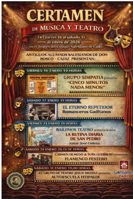
Cartel de la programación del Certamen...