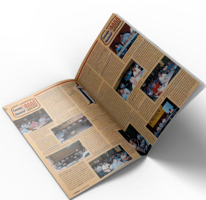
2000_0107 DBE Revista Don Bosco en España , número 636, octubre de 2000.

a los usuarios buscar y acceder a los contenidos de la revista de una manera más eficiente y personalizada. La aplicación ofrecerá archivos para visualización y consulta gratuita, permitiendo a los usuarios acceder a los contenidos de manera libre. Además, contará con una pasarela de pago que permitirá acceder a los mismos contenidos en alta calidad, ideal para su uso en publicaciones como revistas, libros, etc., previa autorización para su uso. Esto no solo generará ingresos para la institución, sino que también permitirá ofrecer soporte técnico especializado para garantizar su correcto funcionamiento y mantenimiento. En conclusión, la digitalización de la revista Don Bosco en España es solo el comienzo de un nuevo capítulo en la historia de los Antiguos Alumnos de Don Bosco. A medida que avanzamos en este camino, nos sentimos inspirados a seguir innovando y a encontrar nuevas formas de compartir nuestra revista, desde sus inicios, en el mundo digital. En un futuro cercano