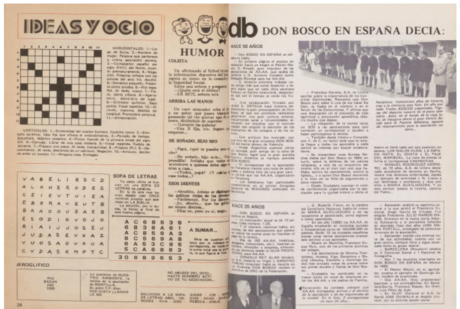
1980_0076 DBE Revista Don Bosco en España , número 417, abril de 1980.

La digitalización de nuestra querida revista es un legado para el futuro de los Antiguos Alumnos de Don Bosco en España. Permite que las generaciones venideras puedan acceder a la historia y a la experiencia de los que nos han precedido, y que puedan aprender de sus logros y también de sus desafíos. Al preservar la historia de la Asociación, se fortalece la identidad y la cohesión de nuestro movimiento. La revista Don Bosco en España ha sido testigo de la evolución de la sociedad española a lo largo del siglo XX, y ha reflejado la presencia y el compromiso de los Salesianos y de los antiguos alumnos en la educación, la evangelización y la promoción social.