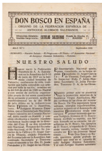
Revista Don Bosco en España , número 1, septiembre de 1922.

El próximo paso en la digitalización de la revista Don Bosco en España es la creación de una aplicación con motor de búsqueda por Inteligencia Artificial. Esta aplicación permitirá