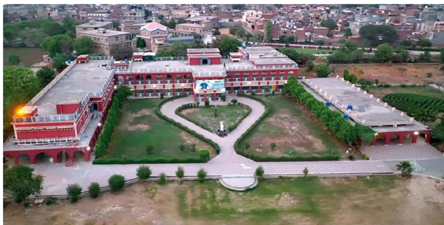
El Instituto Don Bosco de Lahore.